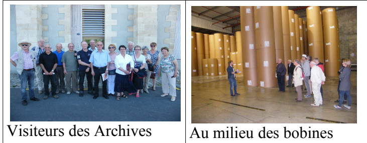
Visiteurs des Archives

Durant cette visite notre guide a mis en évidence les problématiques de l'imprimerie (la chaîne part du papier reçu en bobines jusqu'à l'expédition), nous a expliqué les principes de l'offset (avec la réalisation des plaques) et a répondu aux nombreuses questions pour la satisfaction de tous les participants.